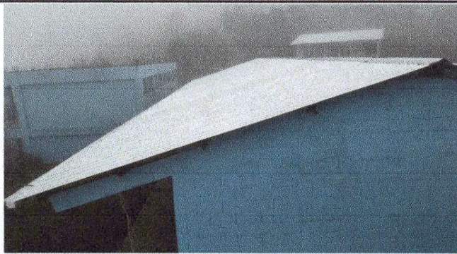
Foto1: Sustitucion de lámina, por lámina troquelada aluzing calibre 26